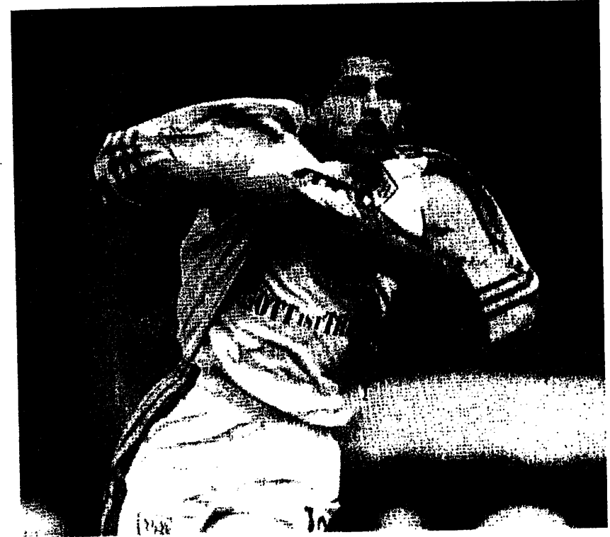
Abb. 3: Der zweifache Torschütze Adhemar bewältigt Kontingenz. 22

Personalstile: Bei besonderen Anlässen kann die Zahl der Ministranten erhöht und ein Chor eingesetzt werden, die Gemeinde kann besser oder schlechter singen, der Priester kann mehr oder weniger vernehmlich sprechen. Aber auf diese Unterschiede kommt es im religiösen Ritual gerade nicht an, weil hier die immergleiche Erfüllung der liturgischen Handlungssequenz im Vordergrund steht.