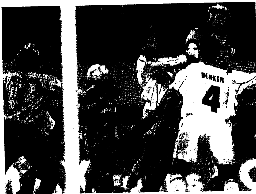
Abb. 2: Richtige Regel am falschen Ort: Oliver Kahn faustet den Ball ins gegnerische Tor. 14

Zu den Vorzügen der Fußballregeln gehört, daß sie leicht an besondere Umstände angepaßt werden können. Obwohl das offizielle Regelwerk nichts darüber sagt, sind in der Praxis nicht alle Regeln gleichermaßen elementar. Man kann hier zwischen konstitutiven und regulativen Regeln unterscheiden. Ob eine Mannschaft aus elf oder, wie im italienischen calcetto oder im spanischen futbolito , aus fünf Spielern besteht, ob man den Ball einwirft oder, wie im Hallenfußball, einrollt, ob das Tor aus einem 7,32 m breiten und 2,44 m hohen Gestänge oder, wie beim Kicken im Park, aus Sporttasche und T-Shirt besteht, ändert nichts an der grundsätzlichen Identität des Spiels. Im Bereich regulativer Regel bewegen sich auch die Regeländerungen der FIFA aus den letzten Jahren, die z.B. das Torwartverhalten beim Elfmeter, das Abseits, die Zahl der Auswechselspieler und den Rückpaß zum Torwart neu festgelegt haben. Ob hingegen alle Spieler oder nur einer (der Torwart) den Ball mit der Hand berühren dürfen, ist eine Unterscheidung, die den Fußball grundsätzlich