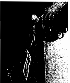
Die Abbildung ist der Website http://www.bonsaitten.com entnommen (besucht am 13. 1. 2005). # zeigt eine junge Katze, die in eine Flasche getan werden soll. Auf der Website werden „Bonsaittens“ zum Kauf angeboten. Es handelt sich angeblich um Katzen, die von Japanern in Glasflaschen aufgezogen und in den Handel gebracht werden. Die Tiere werden mit Hilfe von Sonden ernährt und entleert, ihre Körper passen sich durch knochenverwechende Medikamente der Flaschenform an.

it is presented as something that could have occurred and is told as if it happened“. 20 Es steht allerdings zu vermuten, dass sich das (primäre) Verständnis moderner Sagen von denjenigen anderer wahrheitsbezogener narrativer Textsorten – z. B. persönliche Erfahrungsberichte oder Reportagen – unterscheidet. Wer eine moderne Sage anhört, lässt sich für die Dauer einer Kaffeepause durchaus auf die mögliche Realität dieser Geschichten ein, empfindet Angst, unterliegt der Suggestivkraft erzählter Welten, in denen Zufall durch Providenz ersetzt wird. Danach kehrt er aber wieder in seine Alltagswelt zurück, zumeist ohne den erzählten Ereignissen weiter nachzugehen. Was er im akademischen Kontext oder auch in der lebensweltlichen Praxis überprüfen würde, davon lässt er sich in der entspannten Atmosphäre eines Pausengesprächs zwar beeindrucken, aber doch nicht über dieses Gespräch hinaus. ■